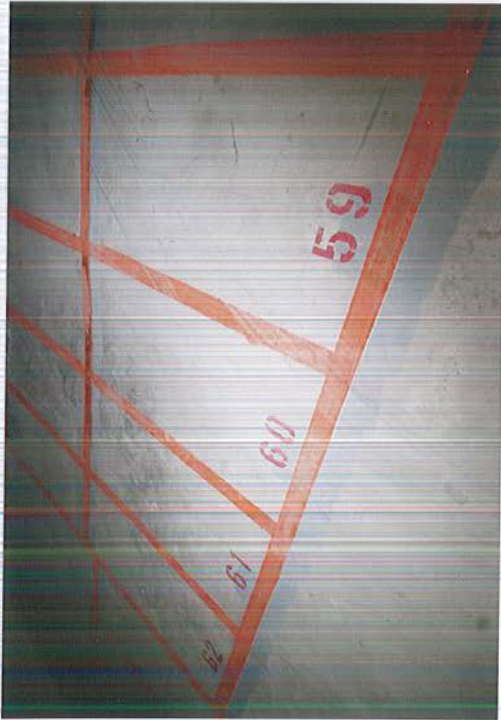
∟ 機車車位 59 ~ 61