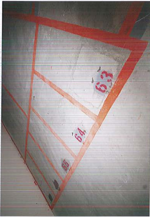
∟ 機車車位 63 ~ 65