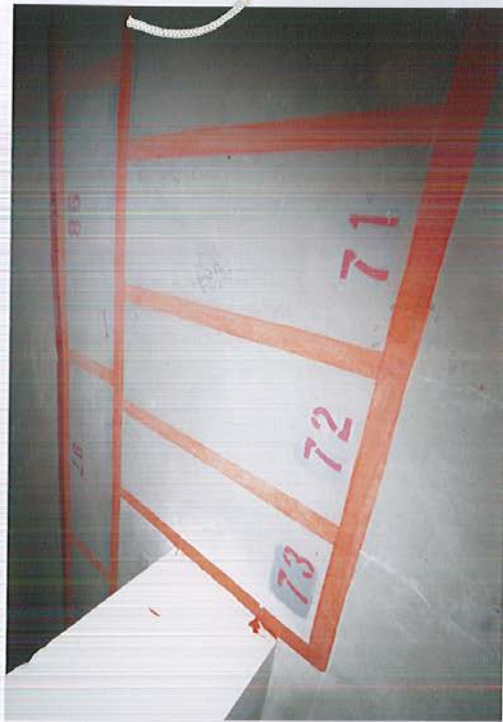
∟ 機車車位 71 ~ 73