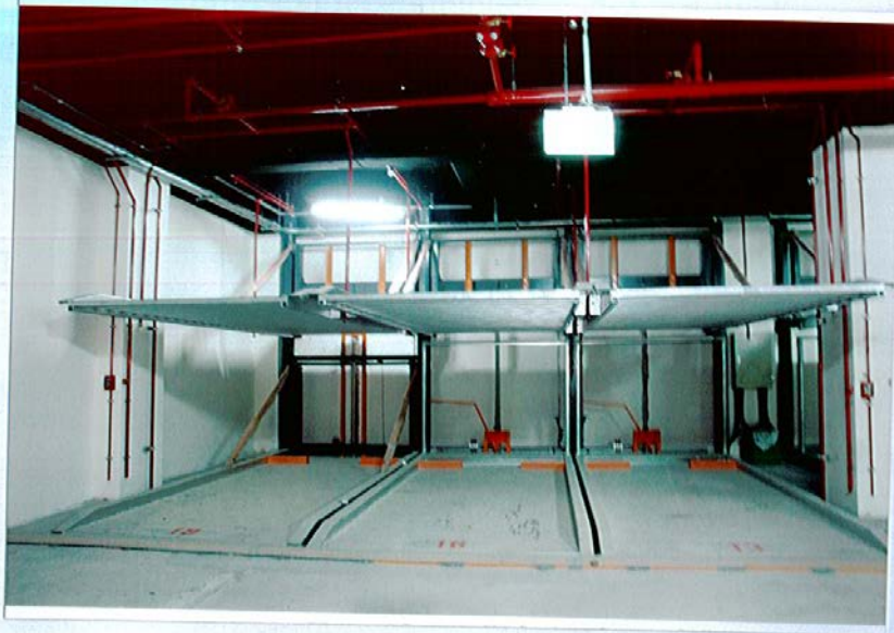
①機械停車空間全景