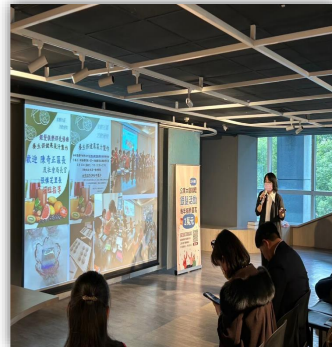
銀髮先修班 成果分享會