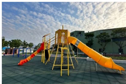
「樹林區彭興親子公園」