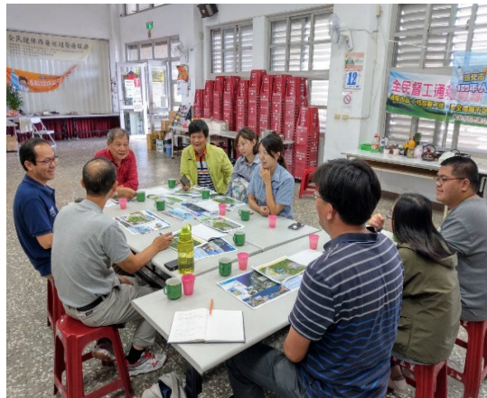
與石門區區長及里長討論「石門區公一公園」設計方案