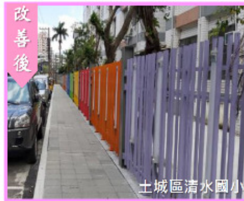
改善重點 4：電桿下地、電箱遷移，行走無障礙