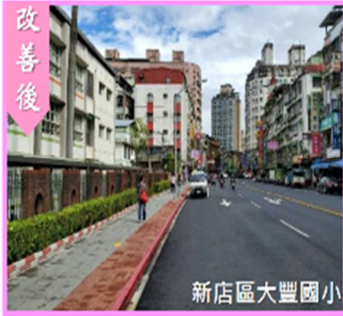
改善重點 3：協調學校圍牆退縮、增設人行空間