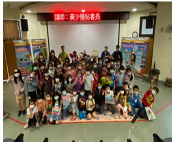
110年3月18日樹林區育德國小