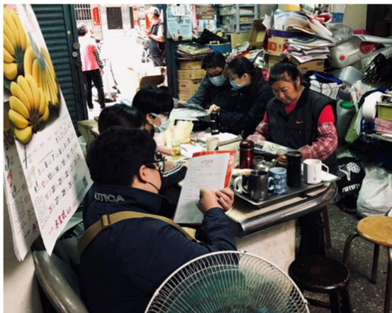
與里長討論里民對於「樹林公 15 公園」的使用需求以及研擬設計方案

方案說明：「樹林公 15 公園」及「石門區公一公園」透過與地方公所及公民、人民團體參與討論，並考量周邊環境及使用族群，打造全齡人口可共同使用的公園環境，並針對不同年齡層規劃合適的活動區域及活動設施。