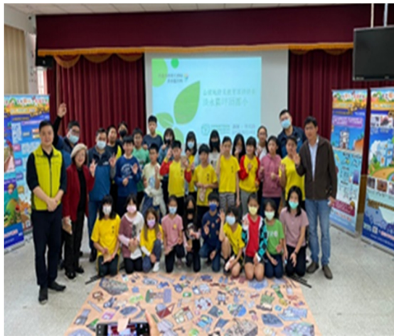
110年3月11日淡水區坪頂國小