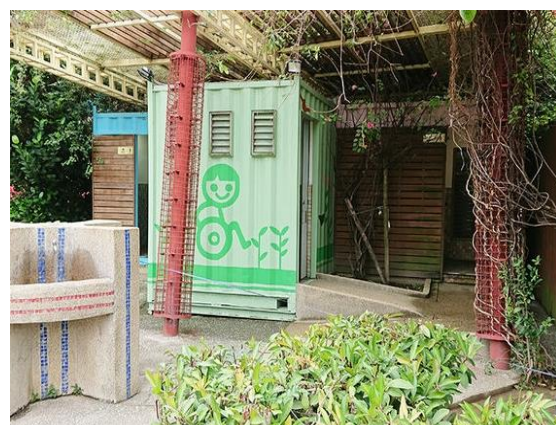
圖二、新莊頭前公園