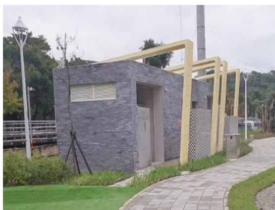
圖一、白雲公園廁所