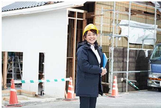
改變建築界的女性力量 7

6 ，我國目前人口數量雖呈現男多於女之狀況，惟未來人口結構將呈現女多於男之趨勢。我國建築師比例應將呈現相應之變化。