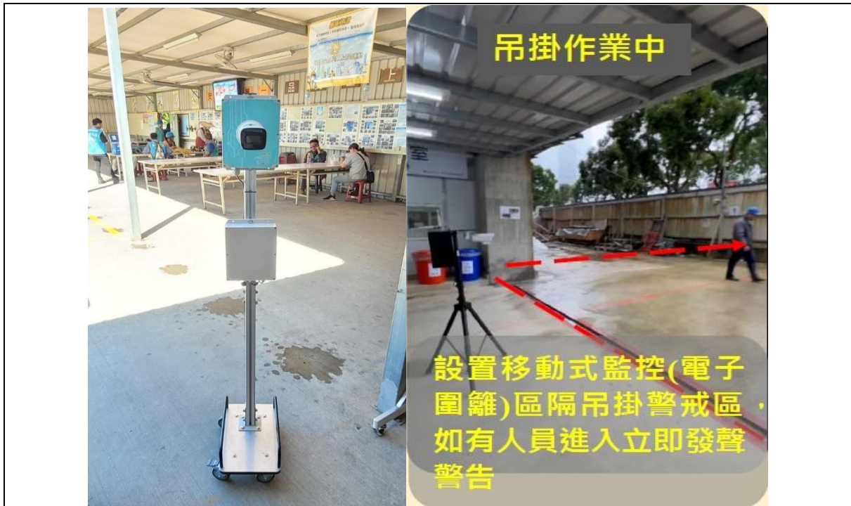
圖六 移動式監控設備