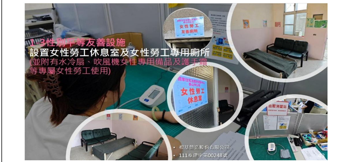
圖二 性別友善設施