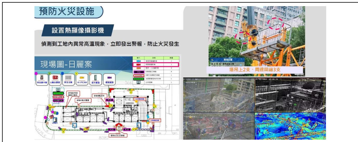
圖三 預防火災設施

另本市建築工地全數採用綠美化圍籬或具美學設計之外觀，提升市容景觀，並有部分自行退縮施工圍籬供公眾通行，顯示業者已逐步將「友善施工」轉化為企業形象資產，並使周邊居民及行人能有更安全友善的通行環境。(如圖四)