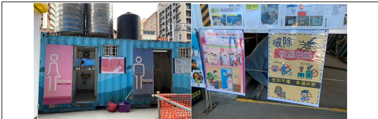
圖七 性別平等友善措施

本評選已明確將「性別平等友善措施」納入評分項目，鼓勵設置性別友善廁所、哺乳空間、女性休息區及性別平權標語等(如圖七)，自113年10月1日起，本府工務局便要求轄內建築工地須設置以上相關設施，協助營造性別友善的工作氛圍，使營建產業逐步邁向多元共融。