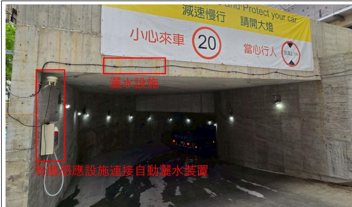
圖五 粉塵感應設施連接自動灑水裝置

自112年10月起，工務局即要求各工地應設置空氣品質感測器、噪音監控設備及有效降低噪音措施，在114年度評選比賽，環境保護局將本評選指標更延伸至連接通報系統及自動化污染防制措施於評選指標，「新美齊The Top集合住宅新建工程」於地下室主要出入口位置，透過設置PM2.5及PM10感應設備連通自動灑水設施，使車輛進出時有效降低揚塵污染(如圖五)，另部分業者導入廢水回收再利用系統與施工區域綠植布置，使工地周邊環境品質明顯改善。