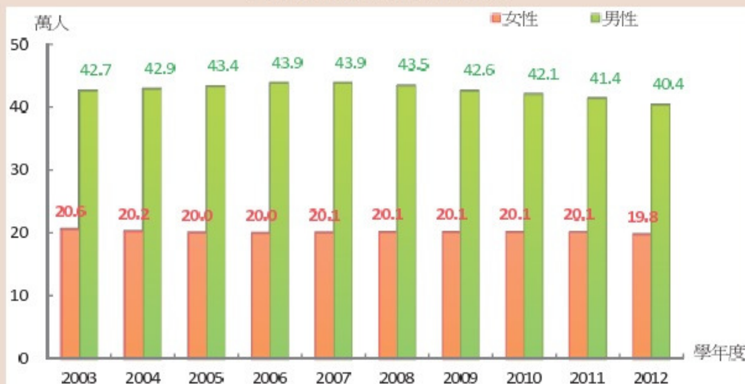
大專校院科技類科學生人數

在高等教育階段，各國普遍存在「男理工、女人文」的性別區隔，以 OECD 國家為例，2009 年醫藥衛生及社福領域女畢業生比率占 75%，較 2000 年增 7 個百分點，電算機學門女畢業生僅占 19%，反降 4 個百分點。我國 2012 學年度大專校院科技類科學生 60.2 萬人，其中女學生 19.8 萬人，占 32.8%，近 10 年維持穩定，顯見就讀領域性別隔離現象並未因高等教育普及而改變。