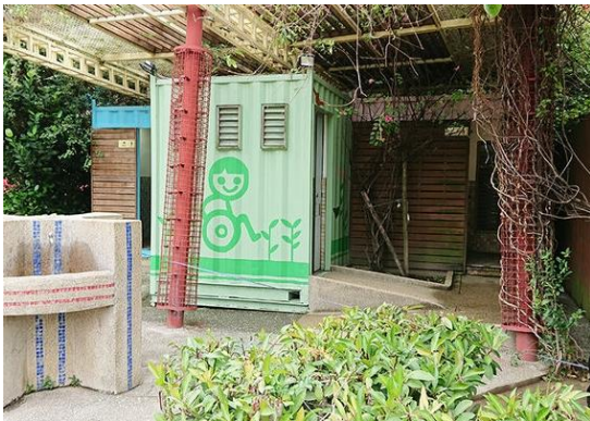
圖三 新莊頭前公園

新建工程處歷年來新闢之公園，僅有汐止公七公園(白雲公園)及新莊頭前公園有廁所，汐止公七公園(白雲公園)有 1 間男大便斗、3 座小便斗、2 間女大便斗、1 間親子廁所及 1 間無障礙廁所，新莊頭前公園有 2 間男大便斗、3 座小便斗及 2 間女大便斗，經調查，自新建工程處開闢完成移交予維管單位後至今，已有 6 座公園由維管單位建置廁所或購置臨時流動廁所，再再顯示建置廁所之必要性。(圖二、三)