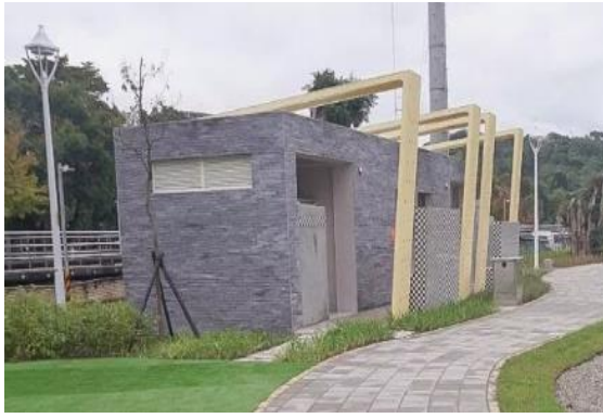
圖二 白雲公園廁所